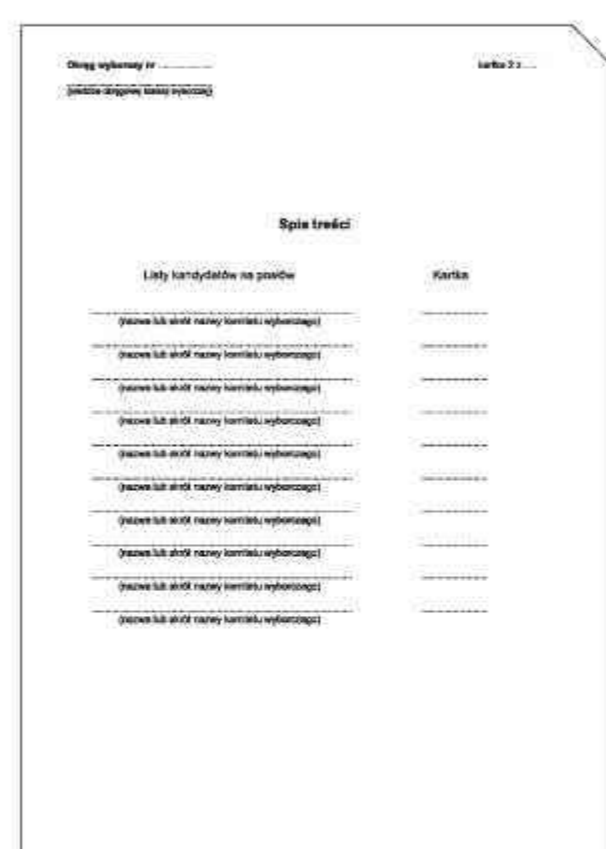
Spis treści (kartka nr 2)