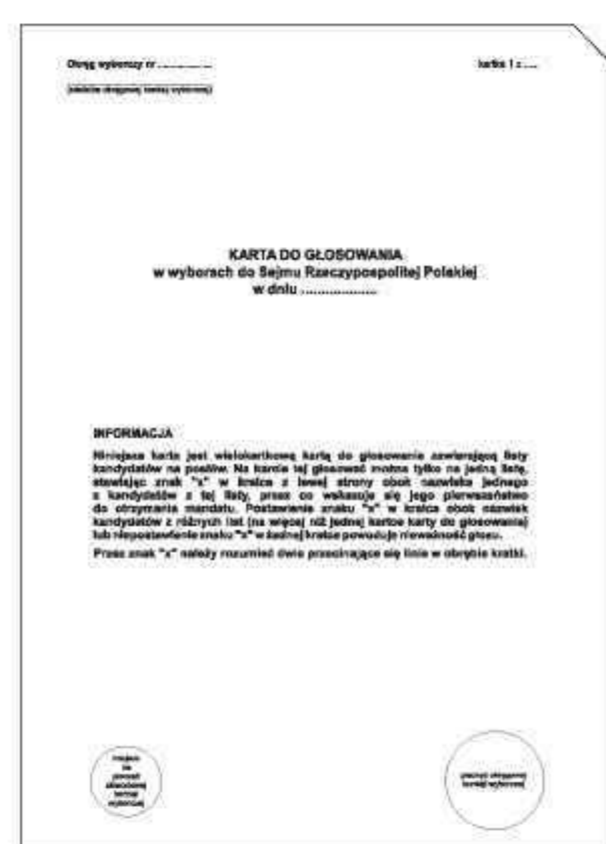
Informacja o sposobie głosowania (kartka nr 1)