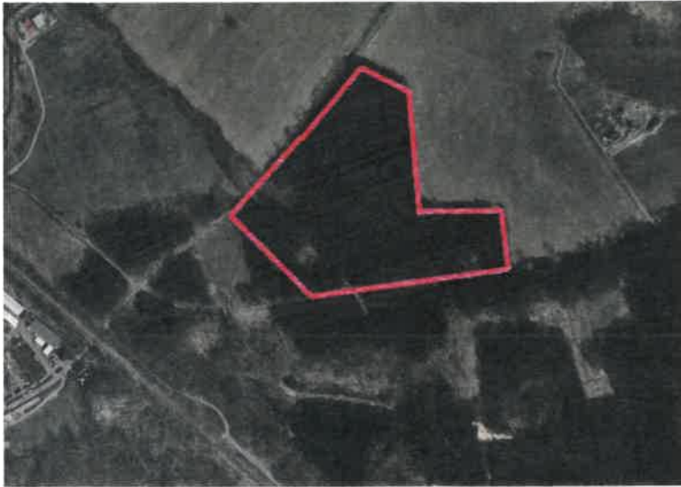
Prawdopodobny zasięg obozu AL. Gassen na ortofotomapie. Oprac. S. Kałagate, N. Piotrowski